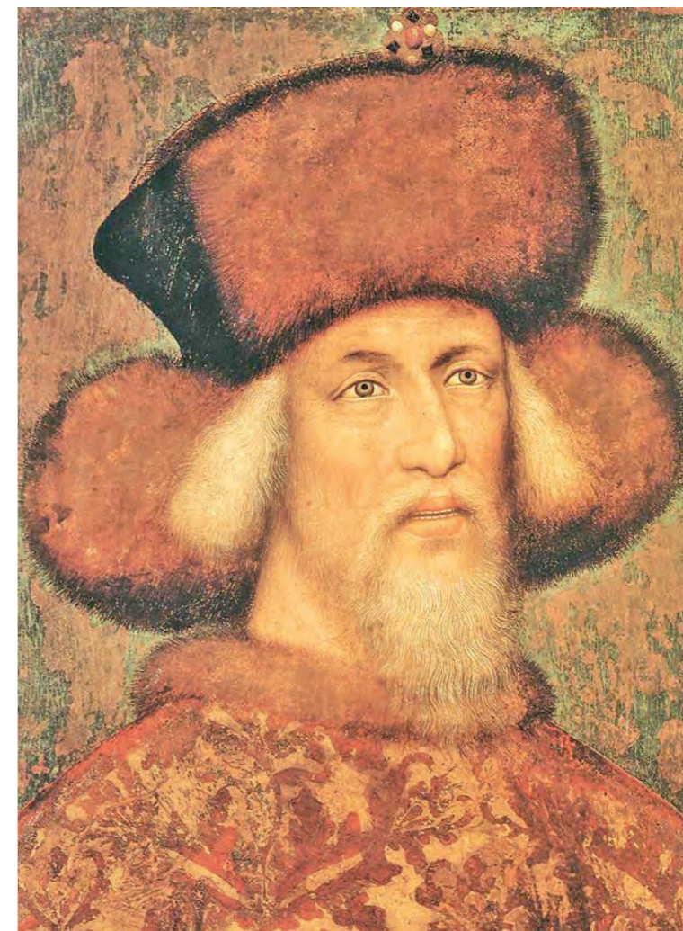
Žigmund Luxemburský, rímsky cisár, kráľ uhorský a český

Rovnako bol niekoľkodňový pobyt kráľa Žigmunda aj so sprievodom na hrade príležitosťou pre vlastníkov obytných domov zo Sereďe a Šintavy, ktorí ponúkali nocovanie za úplatu, pretože areál hradu často všetkých členov sprievodu ubytovať nedokázal. Nemyslíme si však, že takáto udalosť prinášala obyvateľstvu len samé pozitíva. Negatívnymi skutočnosťami mohlo byť olupovanie obyvateľstva príslušníkmi vojenských oddielov, ktoré však velitelia na vlastnom území zvykli trestať. Horším javom bolo skôr neplatenie pohľadávok za tovary a služby zo strany niektorých členov sprievodu, ktoré mohli spôsobovať finančné komplikácie veriteľom. Celkovo však môžeme tvrdiť, že pozitíva v ekonomickej stránke prevažovali nad negatívami. V neposlednej miere mali miestni remeselníci možnosť dôkladne sa oboznámiť s výrobkami pochádzajúcimi od majstrov z ďalších regiónov, čím rozširovali svoje vedomosti a zručnosti.