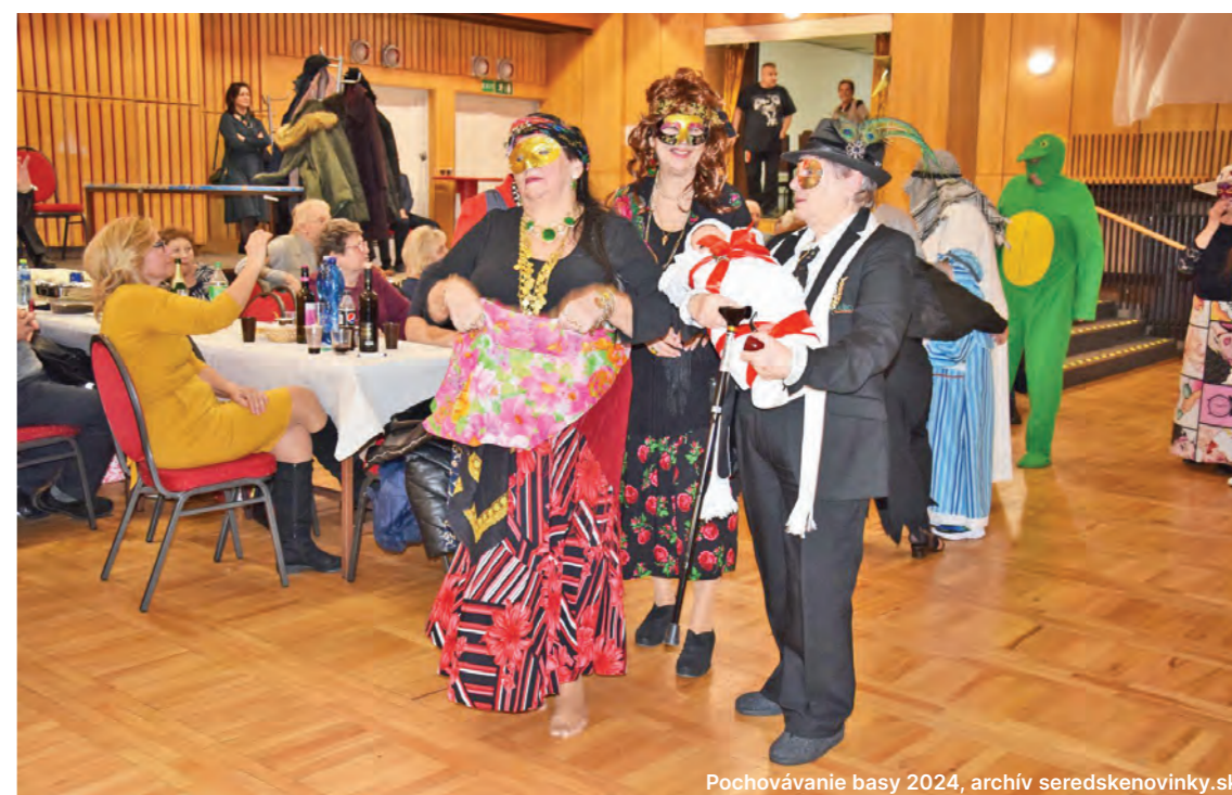
Pochovávanie basy 2024

Hlavným zmyslom Popolcovej stredy je pripomenúť si dôležitosť pokánia, prehĺbenie viery a lásky k blížnym. V kostoloch sa svätí popol, ktorým sa veriacim robí znak kríža. Popol má pripomínať človeka jeho pôvod z zeme a že sa tam po smrti vráti. Tento deň je zároveň prvým dňom pôstu pred Veľkou nocou. Pôst v tento deň má aj ľudový pôvod, verilo