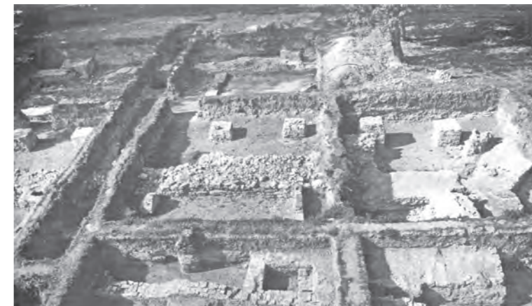
Archeologický výskum Šintavského hradu, ktorý sa realizoval v rokoch 1984 až 1992