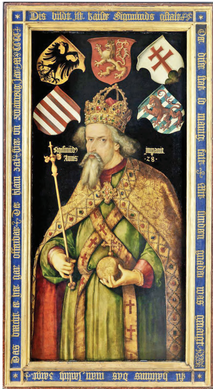
Portrét cisára Žigmunda od Pisanello (Antonio Pisano) z roku 1433, zdroj: wikipedia.org

Žigmund Luxemburský strávil značnú časť svojho života na cestách. Je pravdepodobné, že oblasť súčasnej Sereďe, ktorá ležala na významnej tzv. Českej ceste, navštívil počas života viackrát. Skutočným