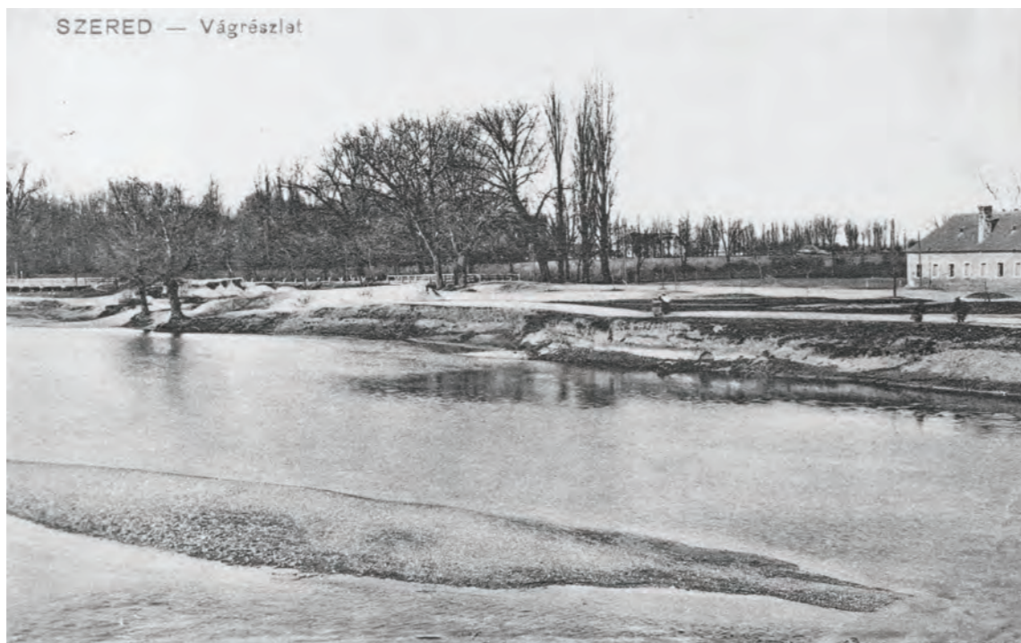
SZERED — Vágrázlat

Na železničnej trati pri Brestovanoch bola 6. februára nájdená výbušná ekrazitová bomba, žandári to vyšetrovali aj v spolupráci s vojakmi, ale vinníka tohto činu nezistili.