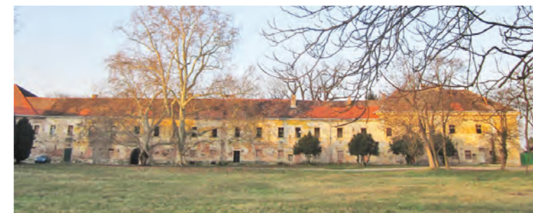
Pod trávnikom v nádvoří kaštieľa sa dnes nachádzajú zvyšky po Šintavskom hrade