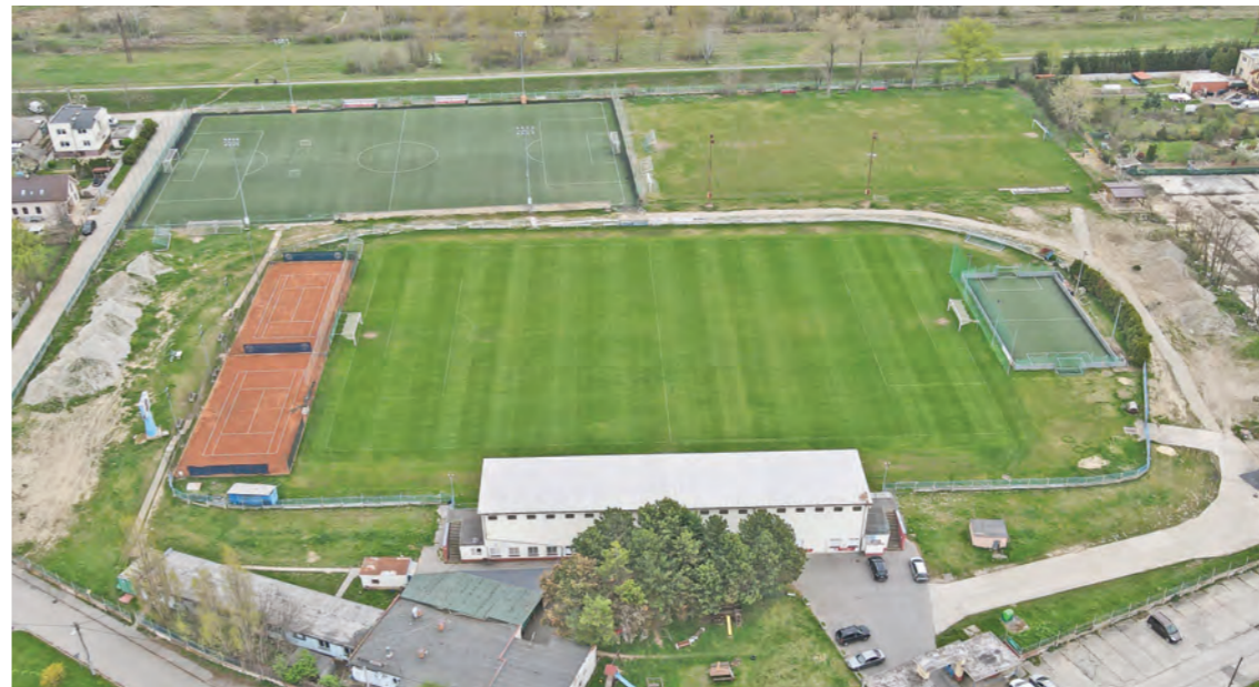
Mestský štadión má svoje najlepšie roky za sebou.