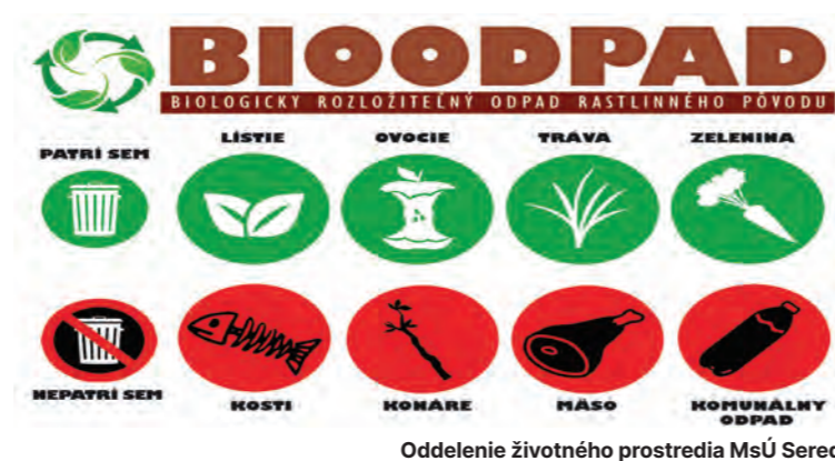
Oddelenie životného prostredia MsÚ Sereď

zberu odpadu podľa ulíc. Posledným dňom zberu čiernych vriec s biologicky rozložiteľným odpadom je pondelok 18. novembra . Prosíme občanov, aby rešpektovali stanovené termíny a v ďalších týždňoch už bioodpad nevykladali. Nebude im vyvezený! V prípade potreby je počas celého roka možnosť odovzdať tento druh odpadu bezplatne na Zbernom dvore mesta Sereď na Cukrovarskej ulici. Ďakujeme.