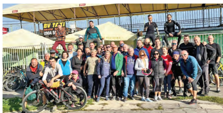
Štvrtý ročník spomienkového memoriálu na kolesách sa vydaval.