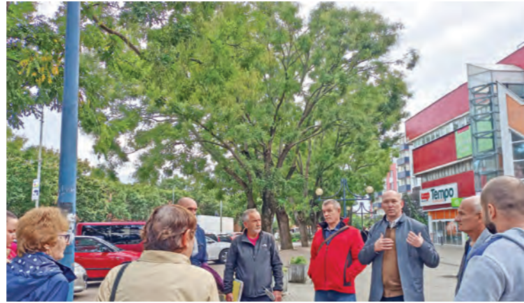
Októbrová Hodina otázok s primátorom v teréne venovala priestor predstavám o budúcim vzhľade námestia.