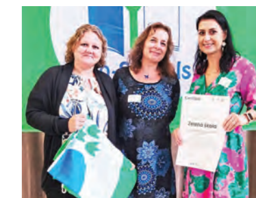
Pripravila Iveta Tóthová

škôl. Medzi nimi si titul opätovne obhájila aj Základná škola Juraja Fándlyho v Seredi, ktorá sa naďalej aktívne podieľa na zlepšovaní životného prostredia. Škola je oprávnená do 30. 8. 2026 používať titul Zelená škola, vlajku Zelenej školy a jej logo uvádzať na svojich dokumentoch, na webe školy a propagačných materiáloch.