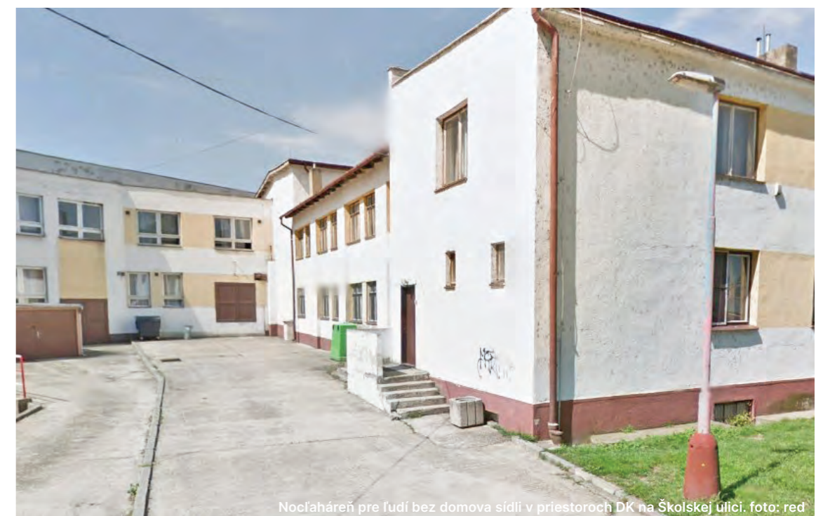
Nocľaháreň pre ľudí bez domova sídli v priestoroch DK na Školskej ulici.