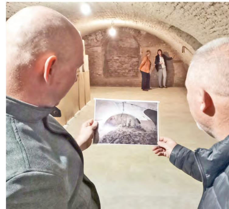
V historickej pivnici seredského kaštieľa.

„Stretnutie priamo v kaštieli som inicioval najmä z dôvodu, že sa niektorí poslanci mestského zastupiteľstva dopytovali na informácie o stave rekonštrukcie. Myslím, že zástupcovia spoločnosti ich na mieste podali podrobne a