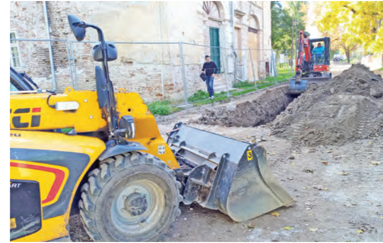
Aktuálne sa pracuje na prípojkách vody, kanalizácie a plynu.