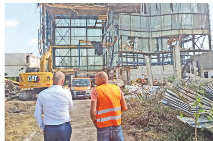
Koniec augusta 2024: Primátor Sereď (vľavo) počas prvých dní prác na demolácii výškovej budovy Milex.

Dobrou vôľou spolupracovať a mať férové vzťahy s mestom už pritom majiteľ Milexu prejavil: nakoľko enviroplácia