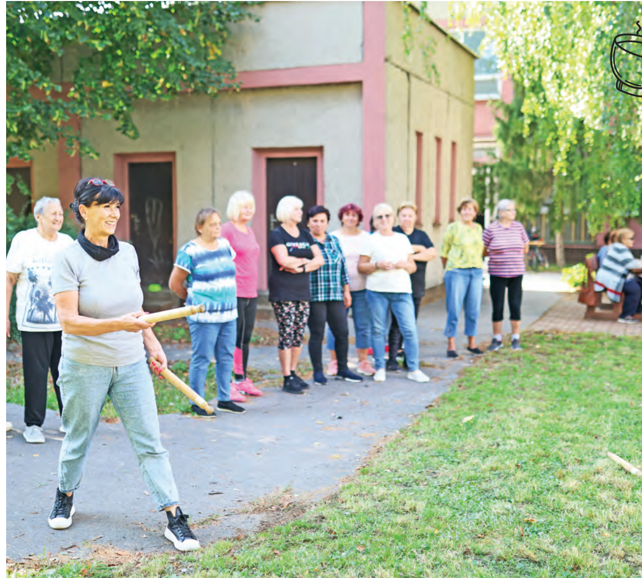
Naši seniori sa pravidelne stretávajú v klube, ktorý sídli v priestoroch na Jesenského ulici. V septembri si napríklad usporiadali vlastný športový deň.

V roku 2018 som ovdovel po 38 rokoch manželstva. Ťažko sa mi začínalo žiť samému. Nevedel som