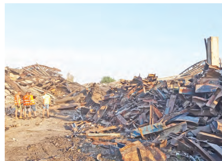
Rovnaký záber, začiatok septembra 2024: po úspešnej demolácii.

„ Mesto malo zo zákona povinnosť zaplatiť približne 8-tisíc eur na likvidáciu vzniknutých odpadov v areáli. Majiteľ Milexu, ako prejav spoločenskej zodpovednosti, zaplatil odstránenie odpadov zo svojich zdrojov, “